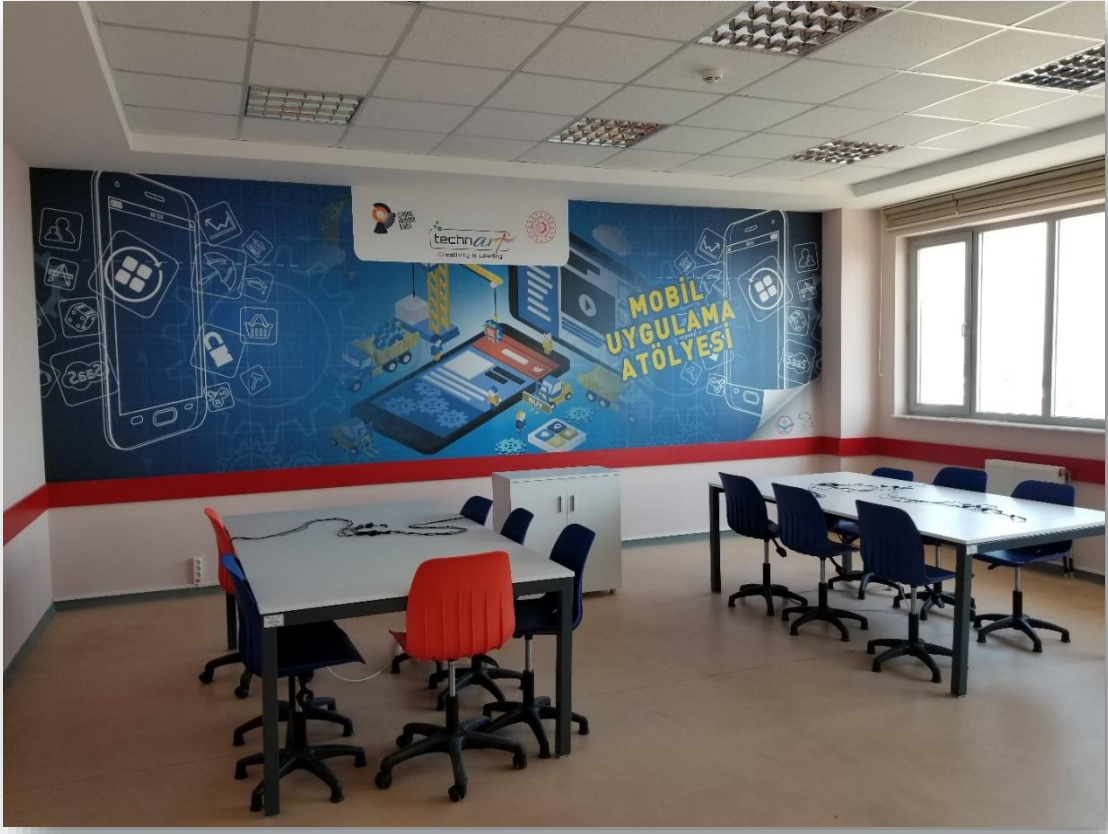
MOBİL UYGULAMA ATÖLYESİ