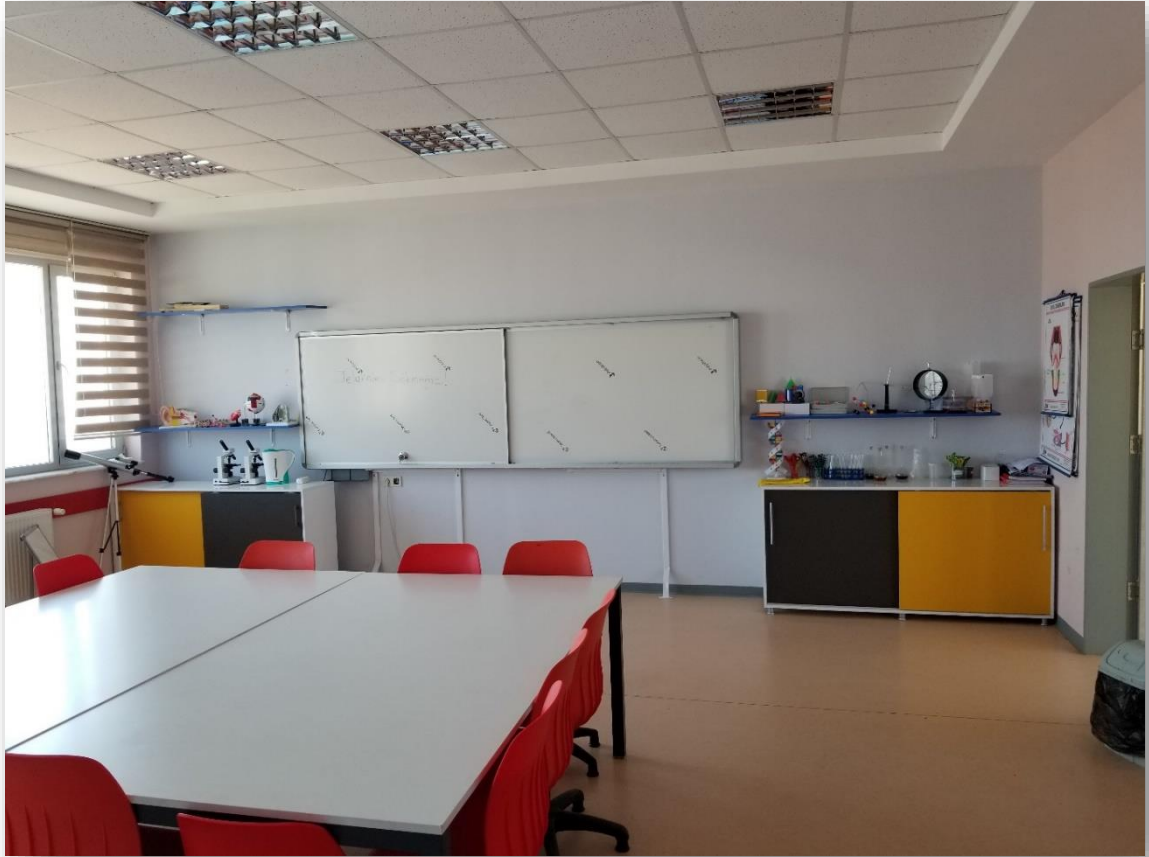
FEN VE MÜHENDİSLİK ATÖLYESİ