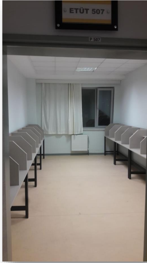
PANSİYON ETÜT SALONU