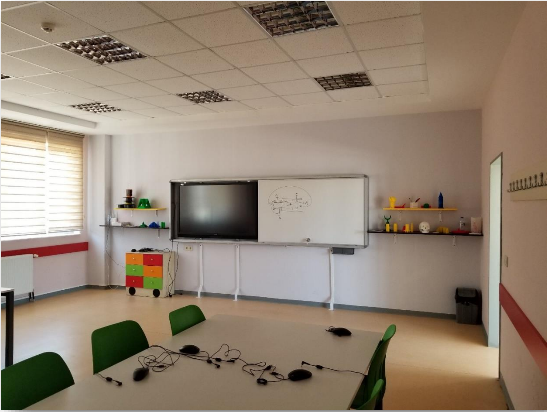
3D MODELLEME ATÖLYESİ