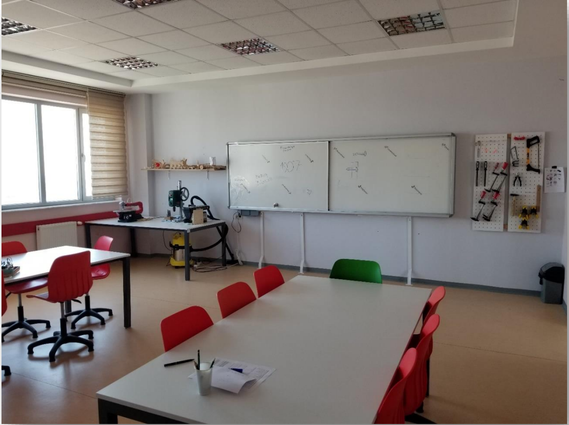
AHŞAP MAKİNELER ATÖLYESİ