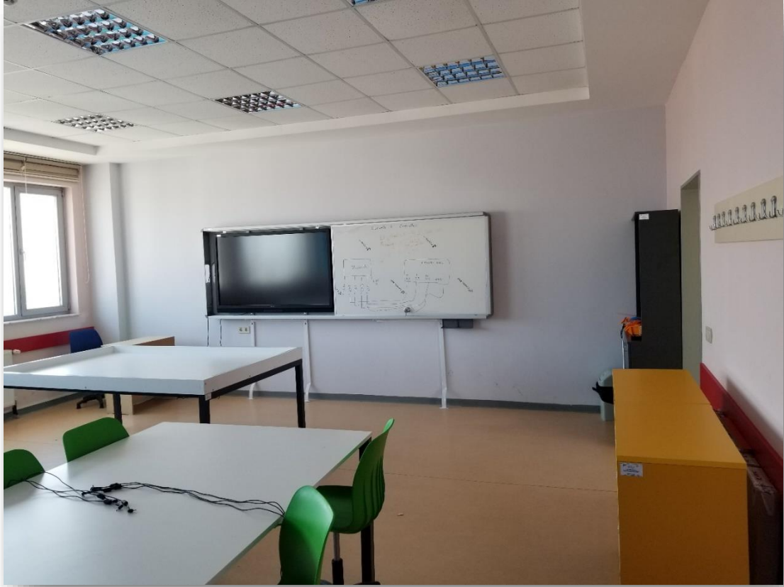
ROBOTİK KODLAMA ATÖLYESİ