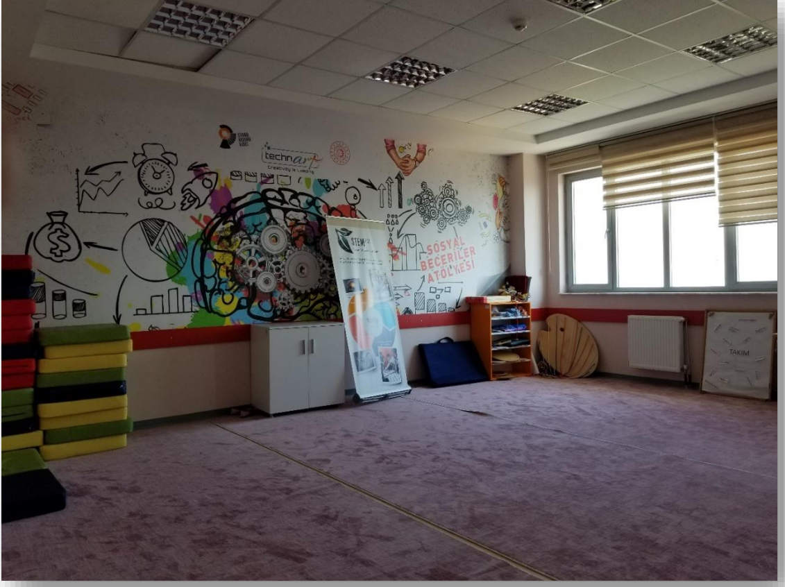
SOSYAL BECERİ ATÖLYESİ